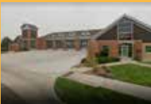
MIÉ., 15 DE OCTUBRE Station 8 Fire House

Más información en c3gov.com/CodeEnforcement