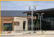
MIÉ., 16 DE ABRIL Bison Ridge Recreation Center