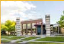
MIÉ., 16 DE JULIO Belle Creek Community Center