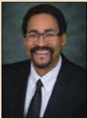
Alcalde Steve Douglas

Commerce City se distingue por la dedicación y el servicio de sus empleados, quienes constantemente hacen todo lo posible para poder brindar ayuda a los necesitados. A pesar de enfrentar desafíos tales como problemas de ruido alrededor del Aeropuerto Internacional de Denver y varios obstáculos socioeconómicos, nuestra ciudad se mantiene firme en su compromiso de encontrar soluciones para todos los residentes.